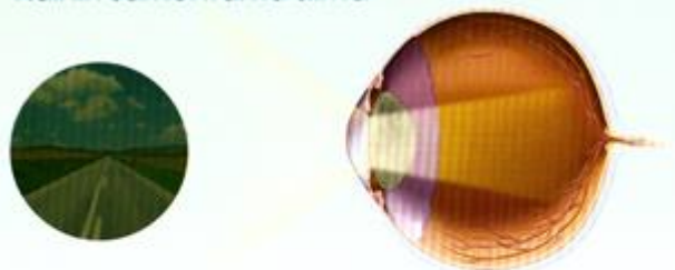
Kaihin samentama silmä

Silmän ikääntyessä mykiö samentuu, jolloin valoa pääsee vähemmän kulkeutumaan verkkokalvolle saakka. Valon laatu heikkenee, koska se hajoo tai siroaa. Näkeminen on tästä syystä epätarkkaa ja sameaa.